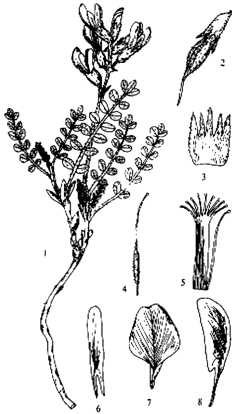
图1 梅里山黄芪 Astragalus meiliensis C. Chen et Z. G. Qian

1. 植株; 2. 荚果; 3. 花萼(展开); 4. 雌蕊; 5. 雄蕊; 6. 翼瓣; 7. 旗瓣; 8. 龙骨瓣