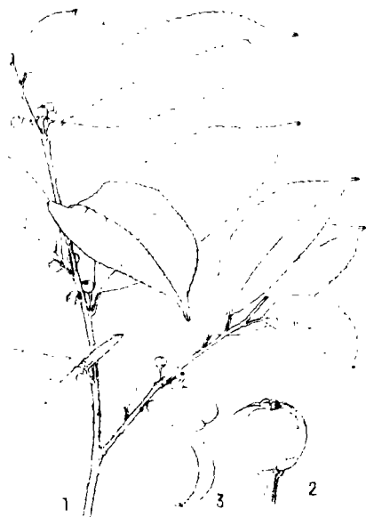
图 2 双果冬青 Ilex dicarpa Y.R.Li, sp. nov.

本种与中间冬青 ( I. intermedia Loesen. ex Diels) 相似; 但叶革质或纸质, 果常为 2 个, 稀单个而不同。