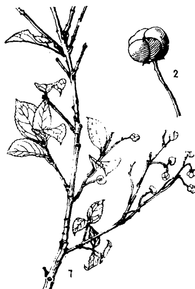
图4 光果卫矛 Euonymus pseudo-sootepensis

Arbuscula, 3 m alta, ramulis assurgentibus, juvenilibus canoviribus, cylindricis anguste sulcatis, vetustioribus rubrobrunneis, gemmae terminales magnae ca. 1 cm longae, in sicco cannae, perulis ad marginem rubro-brunneis, membranaceis, apice ciliatis. Folia chartacea, utrinque vix nitida glabra, elliptica vel ovato-elliptica, 4—6 cm longa, 1.8—2.8 cm lata, apice acuminato vel breviter acuminata, basi late cuneata, margine serrulata, nervis lateralibus 4—5-jugis, utrinque prominentibus, retibus venularum supra impressis, subtus elevatis, utrinque inconspicuis, petioli 3—5 cm longi. Cymae ad supra ramorum axillares, pedunculo 2—3 cm longo. Flores ignoti. Fructus globosus indehiscens 1.2—1.5 cm diam., anguste 4-alatus, ala 2—5 mm lata, exocarpio