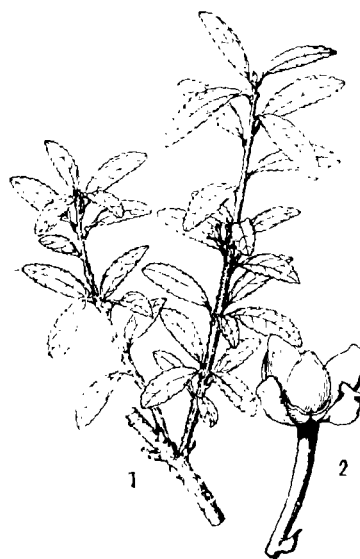
图 3 西藏冬青 Ilex tipetica Y. R. Li, sp. nov.