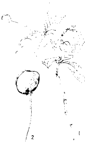
图5 藏南卫矛 Euonymus austro-tibetanus Y. R. Li, sp. nov. 1.果枝, 2.果放大。 (杨建昆绘)

本种与红色卫矛（ E. sanguineus Loes. ex Diels）相似；但果翅很窄，宽2—5毫米，外果皮薄膜质而不同。