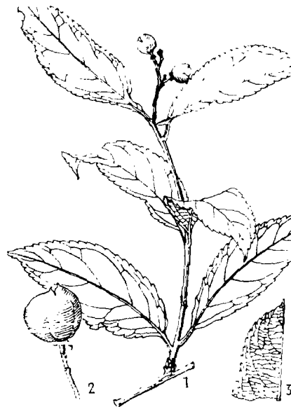
图6 横脉南蛇藤 Celastrus xizangensis Y. R. Li, sp. nov. 1.果枝, 2.果放大, 3.叶部分放大。 (曾晓廉绘)