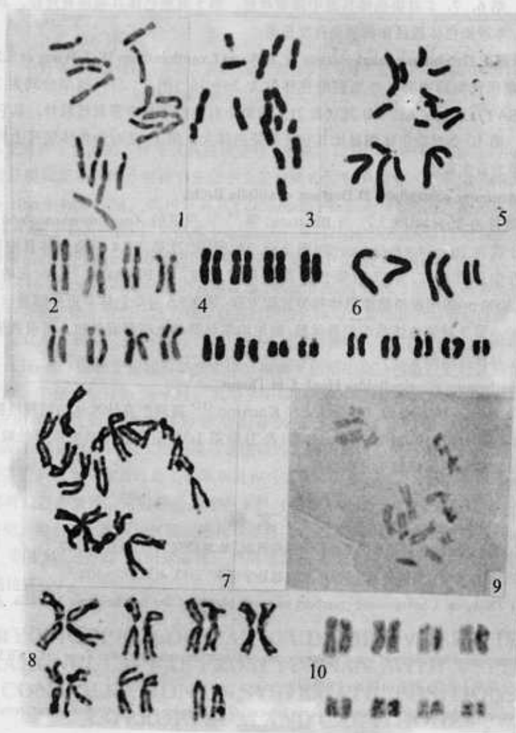
图 2. 细胞有丝分裂中期染色体和核型

广布于我国西南和西北地区的高山, 印度至中亚及西伯利亚也有。体细胞染色体数目为 2n=16 (图 1: 7), 核型公式为 2n=16=6m+6sm+4st (图 1: 8), 2B 型 (表 2), 第 1, 2, 5 对染色体具中部着丝粒, 第 3, 4, 8 对染色体具近中部着丝粒, 第 6, 7 对染色体具近端部着丝粒。染色体数目与分布于美国阿拉斯加西北部、西伯利亚的同种植物的染色体数目相同 (7,8) 。